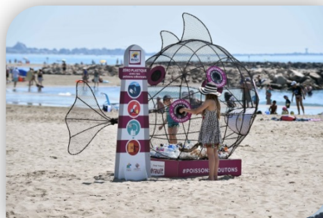
Poissons gloutons installés sur la plage de Carnon et à Lunas