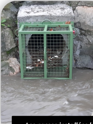
Les nasses installées le long des routes départementales pour retenir les déchets